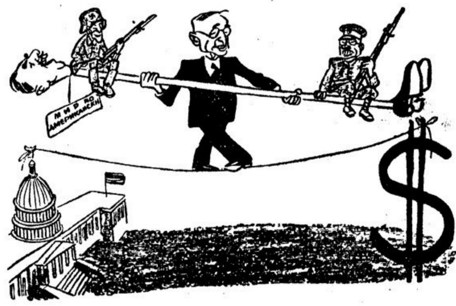
«Мирный баланс» Рисунок А. Пельца из чехословацкого журнала «Торба»

Созывая свой провал, американская делегация в спешном порядке организовала пресс-конференцию. Может, удастся как-нибудь поправить дела! Но янки оказались не в состоянии дать на этой конференции решение парадокса, пришедшего в голову американцам. Как можно утверждать, что разоружению должно предшествовать урегулирование международных проблем, и в то же время сопротивляться разрешению одной из самых значительных проблем — включению китайского народа в число Объединенных Наций? Не свидетельствует ли это о джентльменском вмешательстве, которую возглавляет американское большинство. В Совете Безопасности им мешает принцип единогласия великих держав, и вот они вынуждены вопро: о сохранении мира на компетенции Совета Безопасности, подрывая ООН.