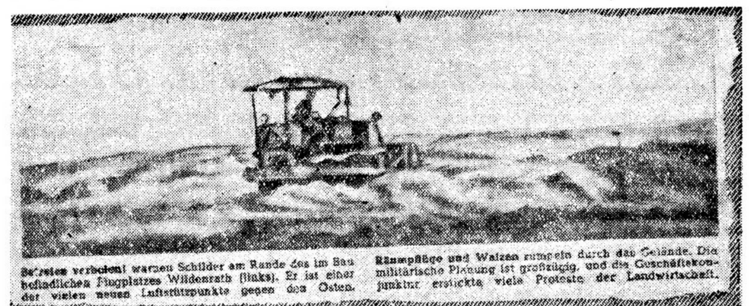
Великие вербовщики войны Шулер и Банде в Вильденрате (Бавария). Их военная программа строительства аэродрома в Вильденрате (Бавария) является одним из пунктов программы восстановления экономики Германии.

Миролюбивые излияния творцов американской «отальной дипломатии» и их единомышленников всегда преследуют одну и ту же цель: затуманить, замаскировать агрессивные планы монополий США. Дымовой завесой фальшивых разглашательствах о мире американские империалисты пытаются прикрыть вооружение Западной Германии.