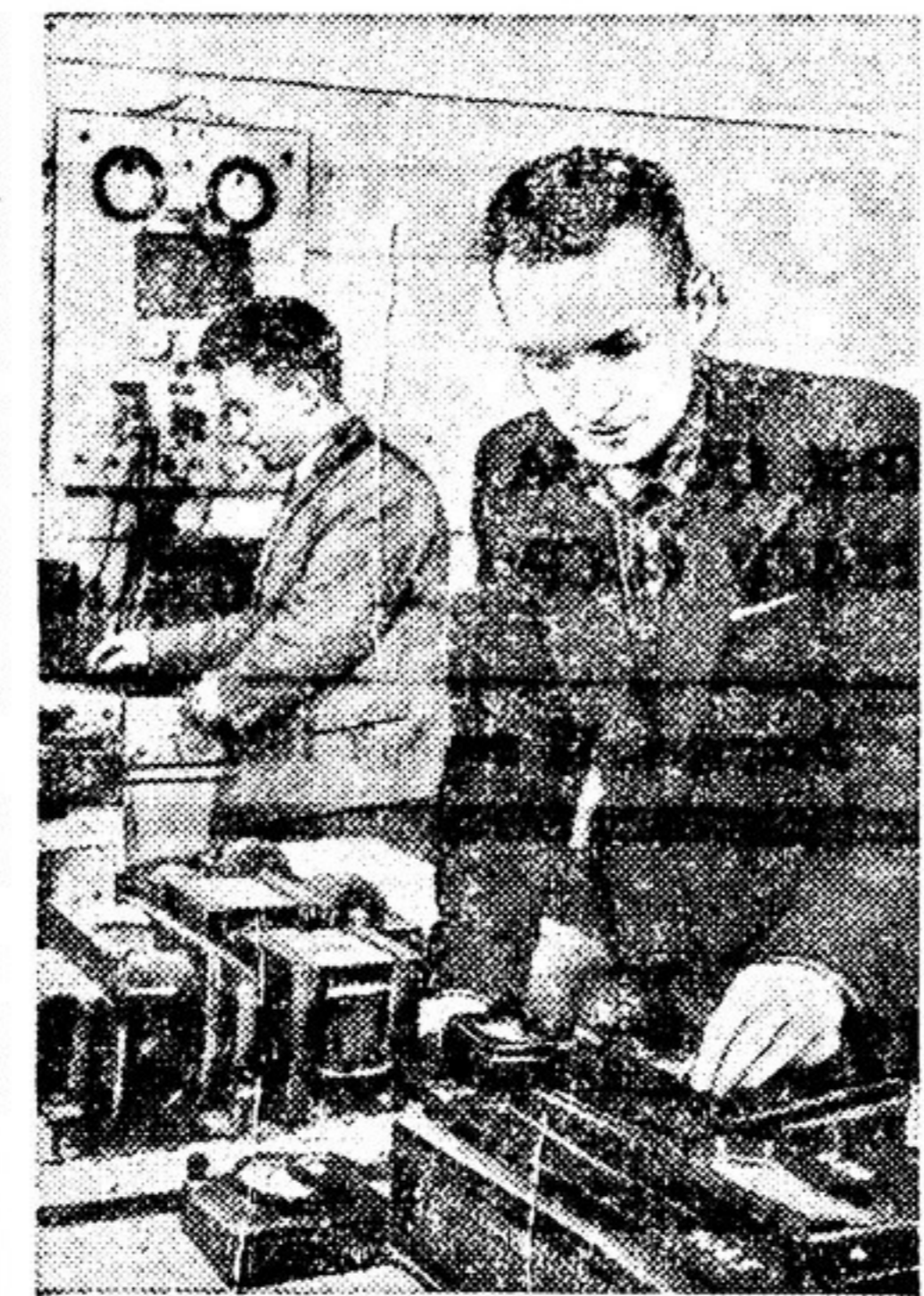
30 лет существует Белорусский государственный университет имени В. И. Ленина. За это время университет подготовил около 8 тысяч высококвалифицированных специалистов...