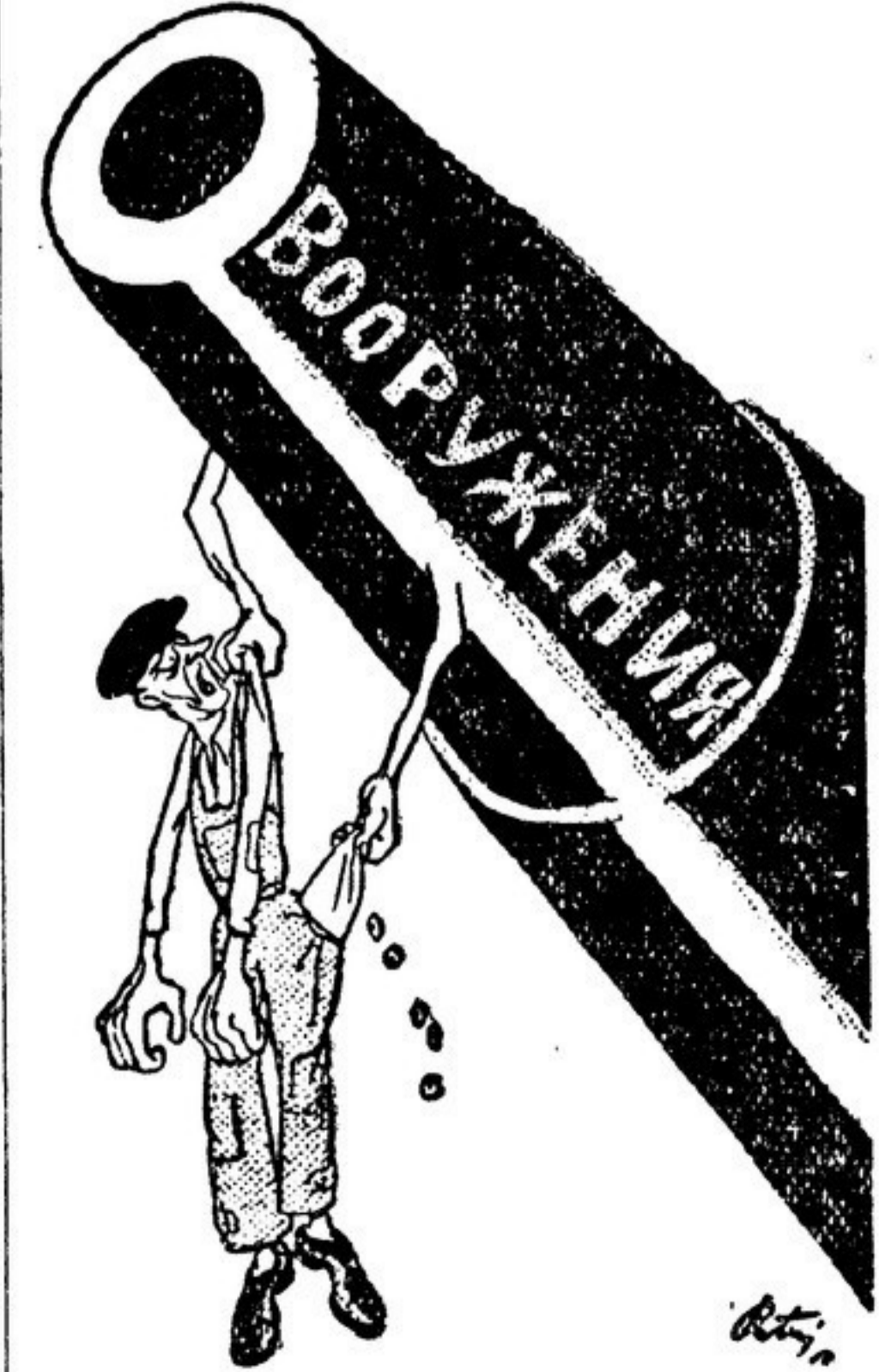
Чувствие, опустошающее карманы трудящихся капиталистических стран. Рисунок из чехословацкой газеты «Лидовые новины».

В самой Америке теперь раздается голоса, которые отнюдь не являются голосами наших друзей, защищающие идею переговоров о запрете атомного оружия. Повторяю, я не хочу вникать в истинные причины, но когда газета «Атланта Джорнал конститьюшн» пишет, что после заявления И. В. Сталина нужно оставить открытой дверь для переговоров о запрете атомного оружия и о международном контроле, я отвечаю: мы можем найти в этой газете общий язык.